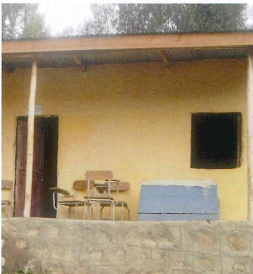
El molt modest espai disponible a la Negus Michael.