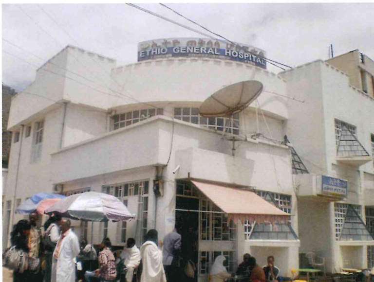
L'Ethio Hospital de Dessie.