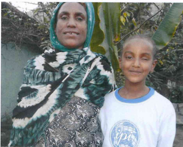
Mare i filla amb estudis becats per IPI de l'escola Negus Michael.

- Ethio Hospital ; clínica amb la que desenvoluparem el conveni de col·laboració. És un centre dotat amb les infraestructures, mitjans i professionals mínims necessaris per garantir una bona cobertura sanitària.